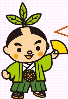
南九州市の地名・苗字の由来や豊玉姫についてのお話など、興味深いものばかりでした。