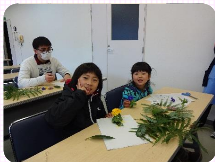
ギシギシでひな人形づくり