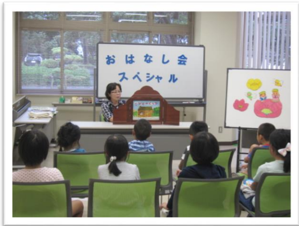
こびとのおはなしに興味津々

10月28日(土)午後3時から、おはなし会スペシャルを行いました。パネルシアターや紙芝居など、4つのお話と“ひっつき虫”でダーツをして楽しみました。