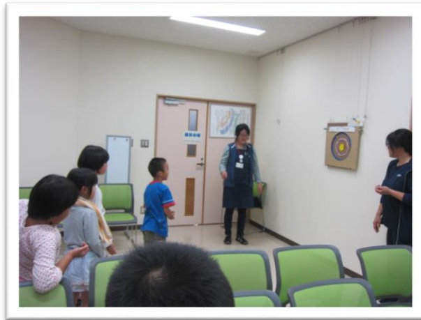
“ひっつき虫”でダーツ！