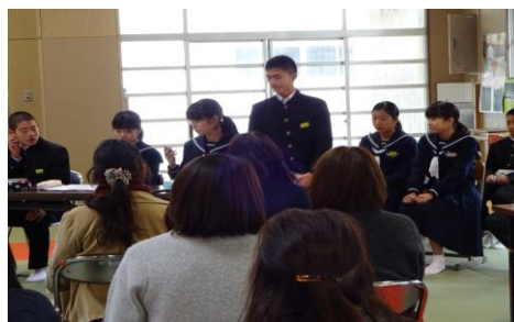
学校図書館運営研究会

読書活動を家庭や地域に広めていくために、家庭への啓発や地域との連携を図り、学校・家庭・地域が一体となった読書活動を推進します。