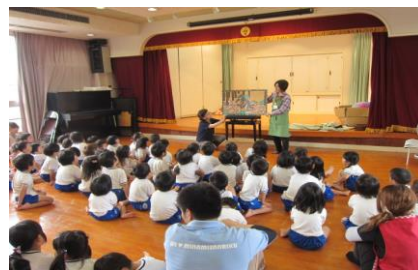
小学校の読み聞かせ