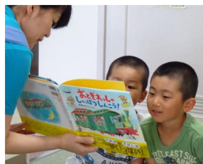
セカンドブックプレゼント

エ 市役所・役場・保健所など、乳児にかかわる事業を行う施設において、本の紹介やチラシの配布等によって保護者の啓発を図ります。